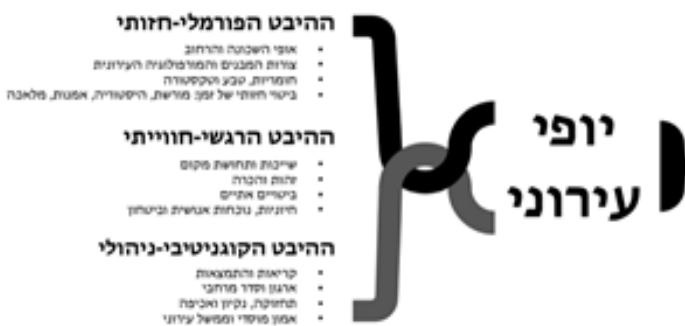
מתוך הדוקטורט: היבטים שונים ליופי עירוני

המחקר מציע מסגרת אנליטית מקורית להבנת יופי עירוני, המשלבת דיון תיאורטי במשמעות האסתטיקה ובקשר שלה לתכנון ערים, עם ממצאים אמפיריים מהמרחב הישראלי. במסגרת המחקר נערכו ראיונות עומק עם 37 אנשי מקצוע: מתכננים, אדריכלים, אדריכלי נוף, נציגי ציבור ויזמים, במטרה לבחון כיצד בעלי תפקידים שונים בשדה התכנון הישראלי מנסחים, מזהים ומעריכים יופי עירוני.